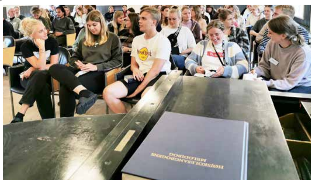
FÆLLES OM SANGEN