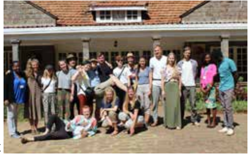
Karen Blixens farm lidt uden for Nairobi

Østafrika anses at være hjemsted for nogle af de tidligste forfædre til mennesket. I det sydlige Kenya og ved Olduvai på den anden side af grænsen til Tanzania, har man fundet cirka to millioner år gamle levn efter hominider. For omkring 1.000 år siden vandrede nogle bantutalende stammer, der i blandt kikuyuernes forfædre, ind i landet fra syd langs kysten. 500 år senere kom andre folk fra nord, blandt dem de nomadiserede masaier. Indvandringen er fortsat ind i moderne tid. I middelalderen begyndte købmænd fra Europa, Asien og Den Arabiske Halvø at besøge Kenyas kyst på jagt efter slaver og elfenben.