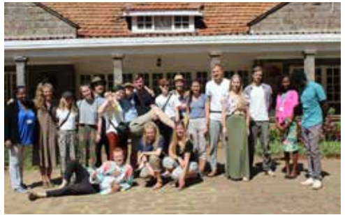
Karen Blixens farm lidt uden for Nairobi

Østafrika anses at være hjemsted for nogle af de tidligste forfædre til mennesket. I det sydlige Kenya og ved Olduvai på den anden side af grænsen til Tanzania, har man fundet cirka to millioner år gamle levn efter hominider. For omkring 1.000 år siden vandrede nogle bantutalende stammer, der i blandt kikuyuernes forfædre, ind i landet fra syd langs kysten. 500 år senere kom andre folk fra nord, blandt dem de nomadiserede masaier. Indvandringen er fortsat ind i moderne tid. I middelalderen begyndte købmænd fra Europa, Asien og Den Arabiske Halvø at besøge Kenyas kyst på jagt efter slaver og elfenben.