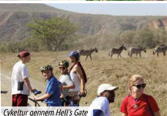
Cykeltur gennem Hell's Gate