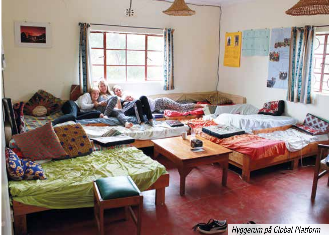
Hyggerum på Global Platform