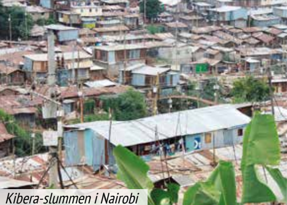
Kibera-slummen i Nairobi