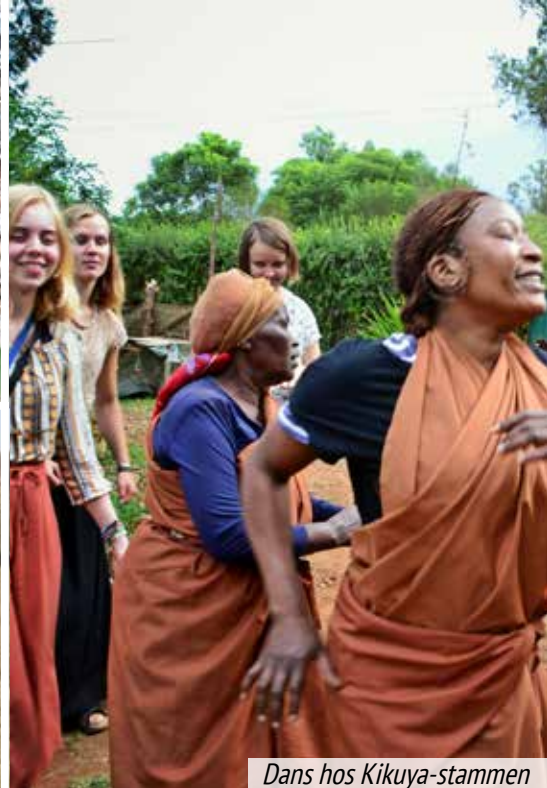
Dans hos Kikuya-stammen