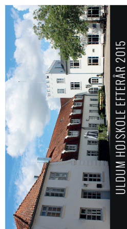
ULDUM HOJSKOLE EFTERÅR 2015